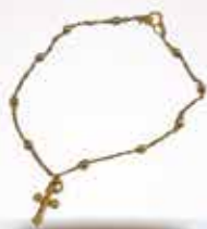
Pulseira folheada em vários modelos