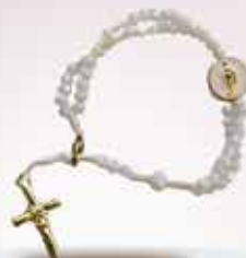
Terço de pulso Nossa Senhora das Graças, em cristal