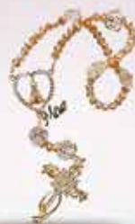
Terço Nossa Senhora Aparecida, em cristal