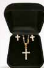
Conjunto de corrente e Brincos folheados