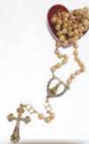
Terço Noiva Pérola Dourado