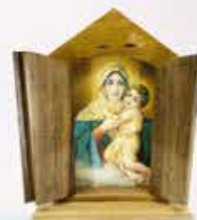
Capelinha de madeira Mãe Rainha