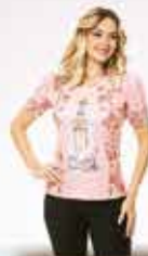
Blusa Baby Look Nossa Senhora de Fátima, cor rosa chá, Ágape