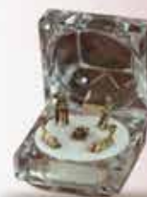
PRESEPIO PORTA JOIA DOURADO COM VERMELHO BRANCO COM PRETO