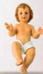
MENINO JESUS 8,10,15,20 E 30 CM RESINA IMPORTADA IRACEMA