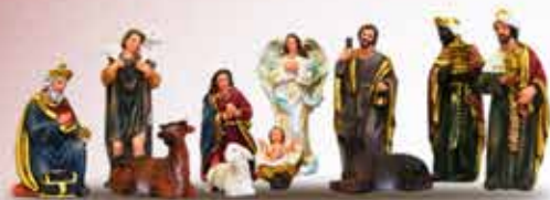
PRESEPIO - 11 PEÇAS - 7,5 CM RESINA IMPORTADA IRACEMA

Um feliz e santo Natal e um Ano Novo de muitas bênçãos!