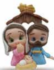
PRESEPIO SAGRADA FAMÍLIA - 7,5 CM BISCUIT NATAL