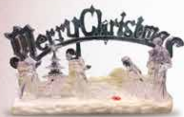
PRESEPIO ILUMINADO MUSICAL 27X37 CM ACRÍLICO IRACEMA