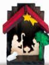
PRESEPIO MADEIRA COM PALMEIRA COLORIDO ARAMON ARTIGOS RELIGIOSOS