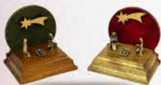
PRESEPIO MADEIRA MINI OURO VELHO E VERMELHO E VERDE ARAMON ARTIGOS RELIGIOSOS