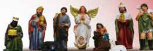
PRESEPIO - 11 PEÇAS - 12,5 CM RESINA IMPORTADA IRACEMA