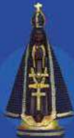
20cm pérola azul resina importada