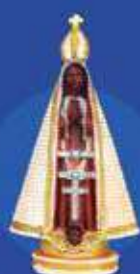
20cm pérola branca resina importada