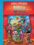
MINHA PRIMEIRA BÍBLIA