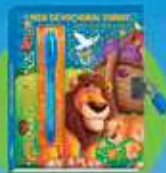
MEU DEVOCIONAL DIÁRIO