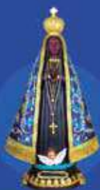
20cm resina importada