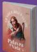
PALAVRA E VIDA

Por meio da meditação e da oração, estes produtos nos convidam a um encontro diário com Deus. Além de mensagens e orações, esta obra traz pensamentos, o santo do dia, datas comemorativas e leituras bíblicas.