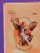
DIÁRIO BÍBLICO 2024

São Miguel Arcanjo/ São Francisco de Assis capa dura