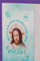
DIÁRIO BÍBLICO 2024