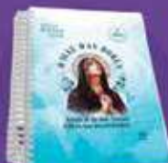
DIÁRIO BÍBLICO 2024